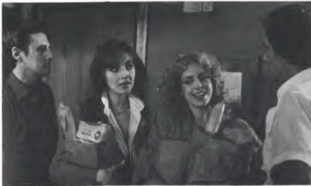
Carlos Larrañaga - Maná Rosaria Omaggio - Sydne Rome - Simon Andreu